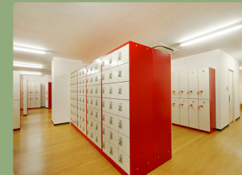
ロッカールーム広々