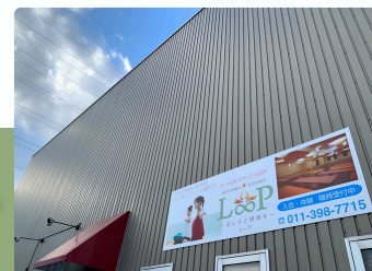
JR学園都市線 あいの里公園駅すぐ